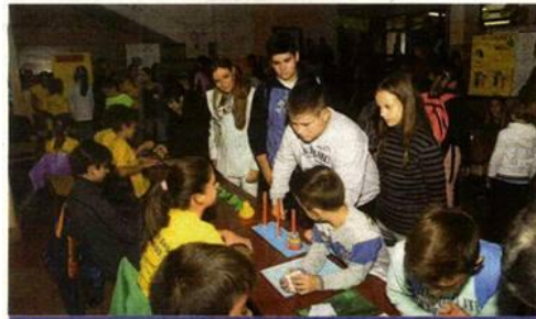
Делић ајшмосфере у школском холу