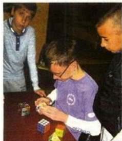
Ко ће брже сложити Рубикову коцку

Овакав тип активности организован је по угледу на Фестивале науке у Београду и Новом Саду, које ученици редовно посећују неколико година, а већ два пута су и учествовали на њему у Новом Саду. Прошле године, у оквиру Sierpinski Carpet Project, на Фестивалу науке у Новом Саду, приказали су пету итерацију тешких Сјерпински и реализовали радионицу за најмлађе посетиоце Фестивала. Ове године су се представили у оквиру такми