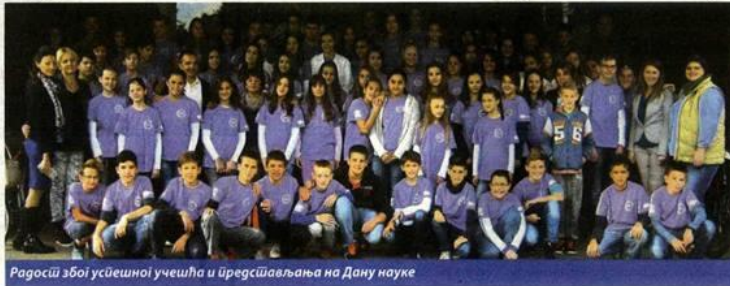
Рагосић збој усјешној учешћа и представљања на Дану науке

чена „Упали лампицу“, које је организовао ПМФ у Новом Саду, уз подршку Центра за промоцију науке, као добитници сребрне плакете. Ученици су посетиоцима приказали Руб Голдбергову машину, коју су тимски направили у школи.